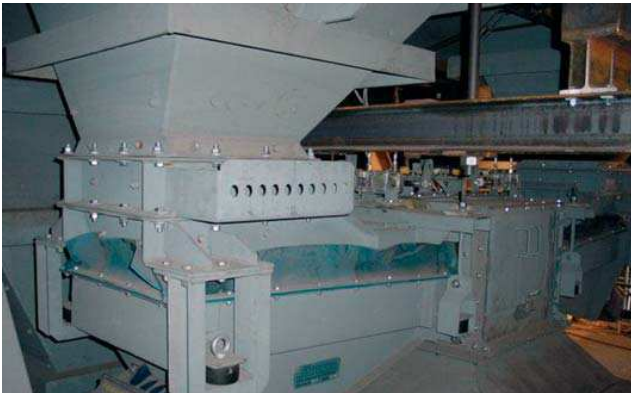
Alimentador vibratorio electromagnético para el peso de la descarga de la tolva