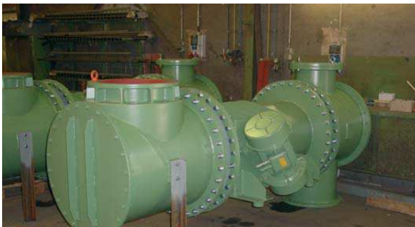
Transportador vibratorio para la operación al vacío a 700 Torr, diámetro 508mm, largo 23600mm con dos juntas verticales