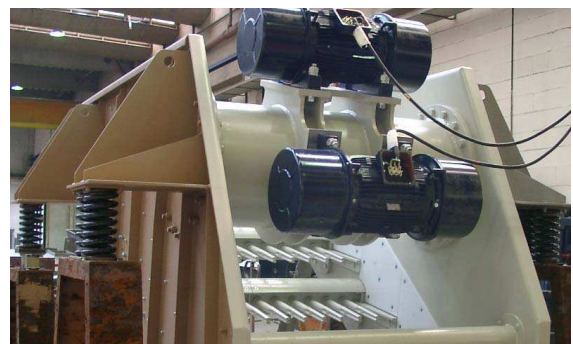
Criba vibratoria para el filtro fino del mineral