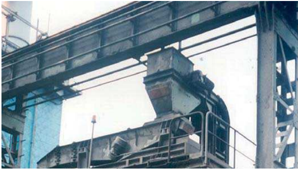
Transportador vibratorio del motor de desequilibrio con un mecanismo giratorio para la carga con caldero