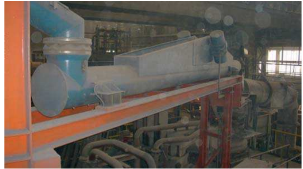
Transportador vibratorio del motor de desequilibrio tubular para la carga del horno LF/de arco