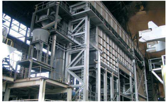
Conjunto de tolvas de aditivos